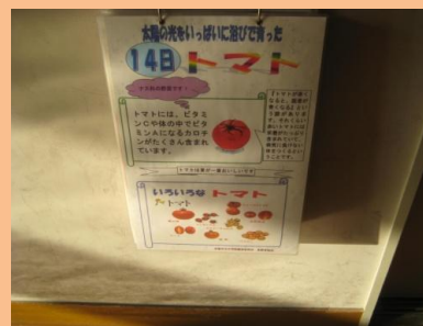
掲示スペースがたくさんあります。