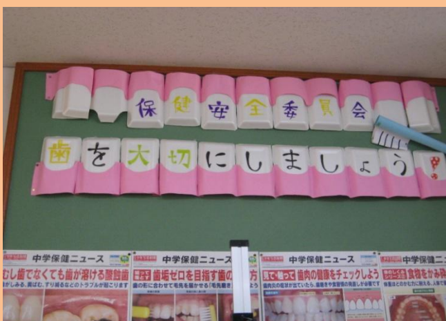
委員の生徒の手作り“歯みがきカレンダー”

保健室に入って、まず目に入るのは、保健安全委員会の生徒が作製した歯の模型（文化祭の展示物）。 スーパーの食品トレーと画用紙で簡単に作ることができる上に、インパクト大！