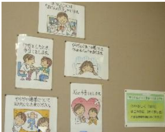
廊下にも大きな掲示板があります→

季節に合わせた掲示物を工夫されています。 今回は、夏の健康をテーマに「熱中症の予防」が 取り上げられていました。