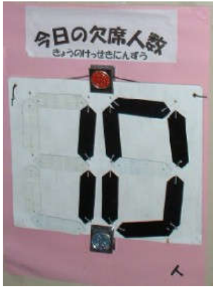
手作りのデジタル表示型欠席人数