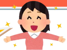
図5 事前セルフチェックシート

生徒の自己評価の妥当性と信頼性を向上させるために、成長を見取る手立てと客観性の視点を加えます。！