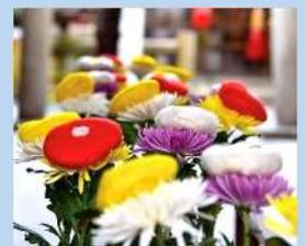
菊のきせ綿 市比賣神社