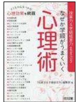
なぜか学級がうまくいく 心理術 『授業力&学級経営力』編集部 編 明治図書