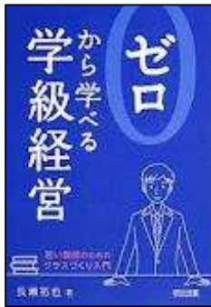
ゼロから学べる学級経営 ～若い教師のためのクラスづくり入門～ 長瀬拓也 著 明治図書

1年間のまとめの時期、今年度を振り返り、新年度につなぐためのヒントとして役立ててください。