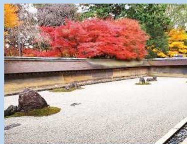
京都人権ゆかりの地 龍安寺